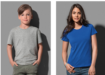
ST2220 Classic-T Organic Kids