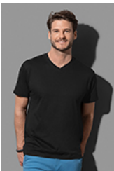
ST2300 Classic-T V-neck