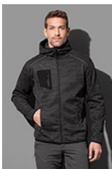
ST5860 Recycled Fleece Jacket Hero