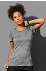
ST8940 Recycled Sports-T Reflect