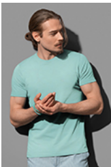
ST9200 James Organic Crew Neck