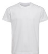
ST9370 Jamie Organic Kids