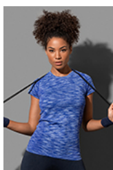
ST8900 Seamless Raglan