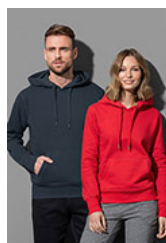
ST5600 Unisex Sweat Hoodie Select