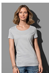
ST9300 Janet Organic Crew Neck