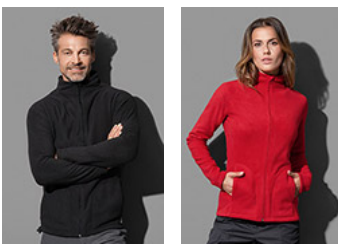
ST5030 Fleece Jacket ST5100 Fleece Jacket